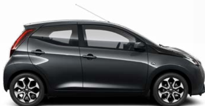
1E0 Antracitszürke metálfényezés 105 000 Ft