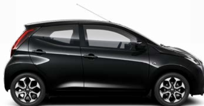
211 Éjfékete metálfényezés 105 000 Ft