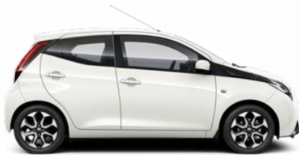
068 Hófehér felár nélkül