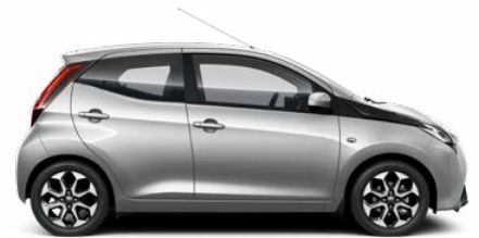
1E7 Szaténézüst metálfényezés 105 000 Ft