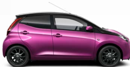
9AC Magenta metálfényezés csak az x-cite bi-tone (kéttonusú) változatban rendelhető 105 000 Ft