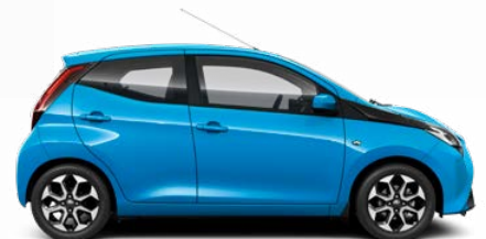
8W9 Ciánkék metálfényezés csak az x-play változatban rendelhető 105 000 Ft