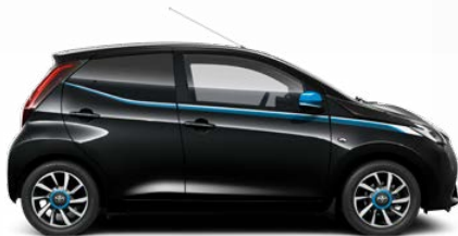
211 Éjfékete ciánkék díszítéssel metálfényezés csak az x-treme változatban rendelhető