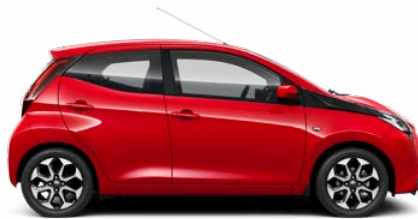
3P0 Tűzpiros 40 000 Ft