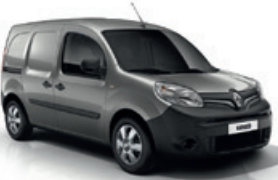
Vakond szürke (KNU)